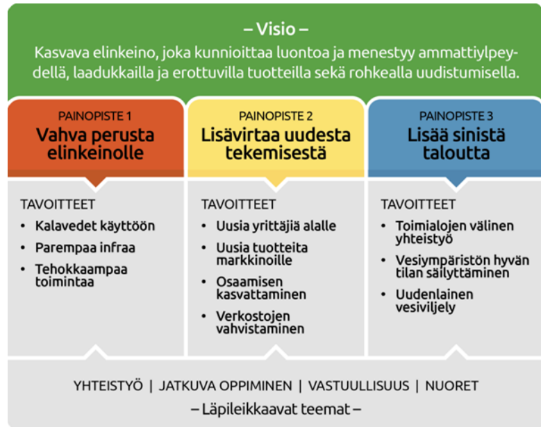
Kuva 1. Strategia tiivistettynä

Kainuun ja Koillismaan Kalaleader -strategialla tavoitellaan elinkeinokalatalouden kasvua ja kannattavuuden parantumista sekä niistä toteutusalueelle aiheutuvia hyötyjä muun muassa työpaikkoina, uusina yrityksinä, investointeina ja myönteisinä vaikutuksina vesistöjen tilaan. Strategian visio, kolme painopistettä tavoitteineen ja läpileikkaavat teemat on tiivistetty kuvaan 1.